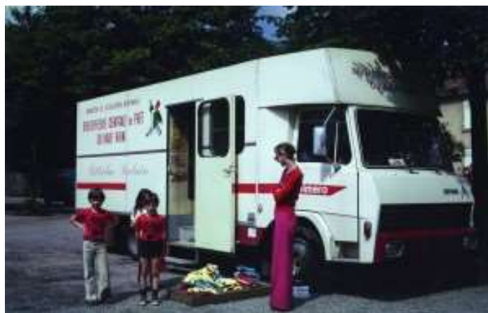
Figure 2 : Bibliobus. Photographie du fonds de la médiathèque départementale du Haut Rhin

Cette phase de consolidation s'appuie sur la volonté d'introduire l'animation culturelle. En 1982, l'informatisation des BCP est planifiée par la Direction du livre et de la lecture. La politique culturelle est ambitieuse et souhaite compléter le réseau des BCP dans les départements qui en sont encore dépourvus.