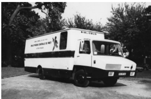
Figure 1 : Bibliobus. Photographie du fonds de la médiathèque départementale du Haut Rhin

Implantées dans les chefs-lieux départementaux, les BCP apportent leur soutien dans les communes de moins de 15 000 habitants, par l'action conjuguée d'une bibliothèque centrale et d'un bibliobus. Schématiquement, une première phase de développement (1945-1964) s'opère autour de huit départements (Aisne, Dordogne, Isère, Loir-et-Cher, Marne, Haut-Rhin, Deux-Sèvres, Tarn) et d'une action principale de dépôt.