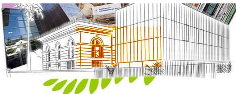
Figure 4 : Bibliothèque départementale de la Réunion