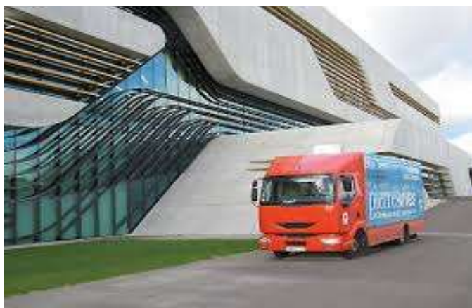
Figure 3: Pierresvives, bibliothèque départementale de l'Hérault

L'ordonnance n° 2017-650 du 27 avril 2017 modifiant le livre III du code du patrimoine titre III article L.330.1 transforme les BDP en bibliothèques départementales (BD) , Cette ordonnance accompagne la dernière réforme territoriale qui renomme les conseils généraux en conseils départementaux.